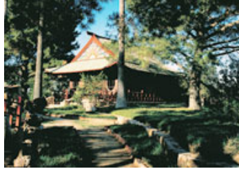
Hidden Valley (California)