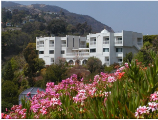
Lake Shrine (California)

http://www.yogananda-srf.org/tmp/centers.aspx?id=92#.UN2dhOQsCSO