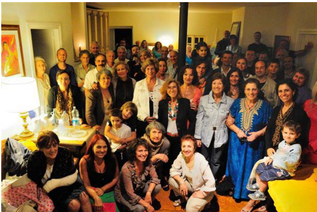
Il Comitato di Coordinamento

All’interno del notiziario troverete notizie, approfondimenti e resoconti di eventi appena trascorsi, come il bellissimo incontro prima della pausa estiva a casa dei nostri cari amici di Cave, al quale abbiamo partecipato veramente in massa! Sul sito web del Gruppo ( http://www.yogananda-roma.org/incontri.htm ) potrete vedere altre foto scattate durante la serata.